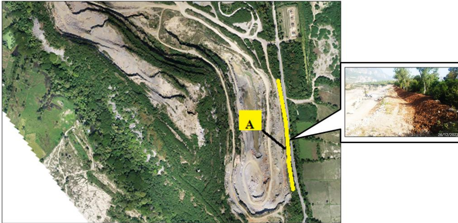
รูปที่ 1.3-1 พื้นที่ทำการฟื้นฟูบริเวณหน้าเหมือง